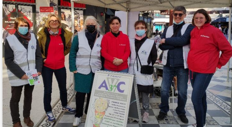
26/02/21 Stand de prévention et de soutien avec les bénévoles France AVC37 et l'équipe des Raid'hot 2021 à l'Heure tranquille à Tours.