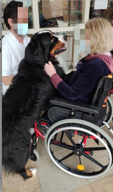
Djamel chien Bouvier Bernois